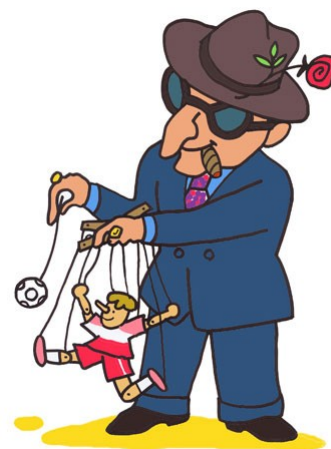
Retribuzioni annue lorde

Riprendiamo il concetto di retribuzione annua media, lorda, del "Sole 24 Ore" e calcoliamo la retribuzione annua di un dipendente del Ministero del Lavoro, ex B3, e seguiamo la sua variazione nel corso degli anni.